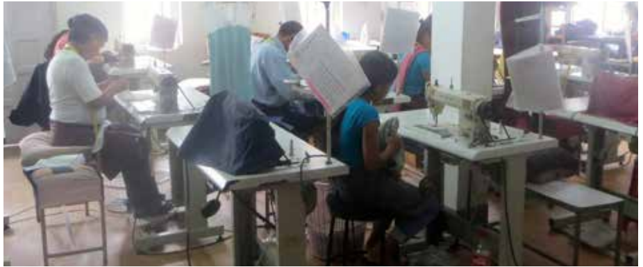
Be-Suited Nepal Pvt. Ltd in Kathmandu bleek de beste kandidaat om het kledingproject mee op te pakken.

Tot ons geluk heeft zich daarbij een particuliere sponsor aangediend die dit project - op